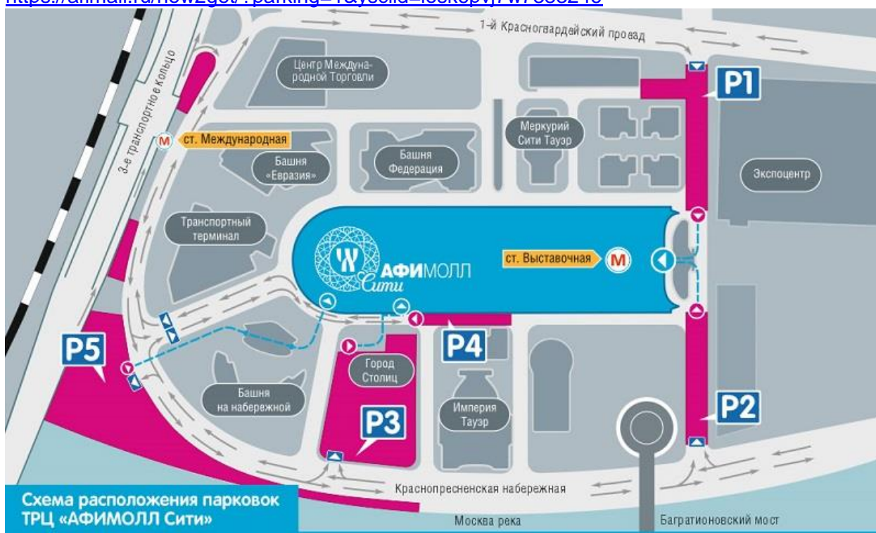
Схема расположения парковок ТРЦ «АФИМОЛЛ Сити»

https://afimall.ru/how2get/?parking=1&ysclid=losk6pxj7w7383246